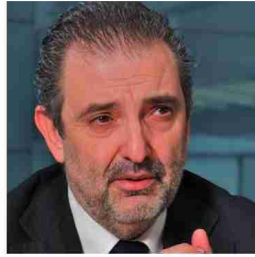
Luis Miguel Gilpérez, presidente de Telefónica España

Somos optimistas y vemos indicios claros de reactivación en 2013 en lo que se refiere a las telecomunicaciones. El mercado está activo, es dinámico y crece día a día. Es cierto que hay una competencia intensa que repercute en los ingresos, pero está fuera de duda que las comunicaciones forman parte, y cada vez más, de la vida de la gente. Están en nuestro ocio, en nuestro trabajo, en nuestro día a día, y los prestadores de estos servicios tenemos oportunidades importantes que debemos aprovechar.