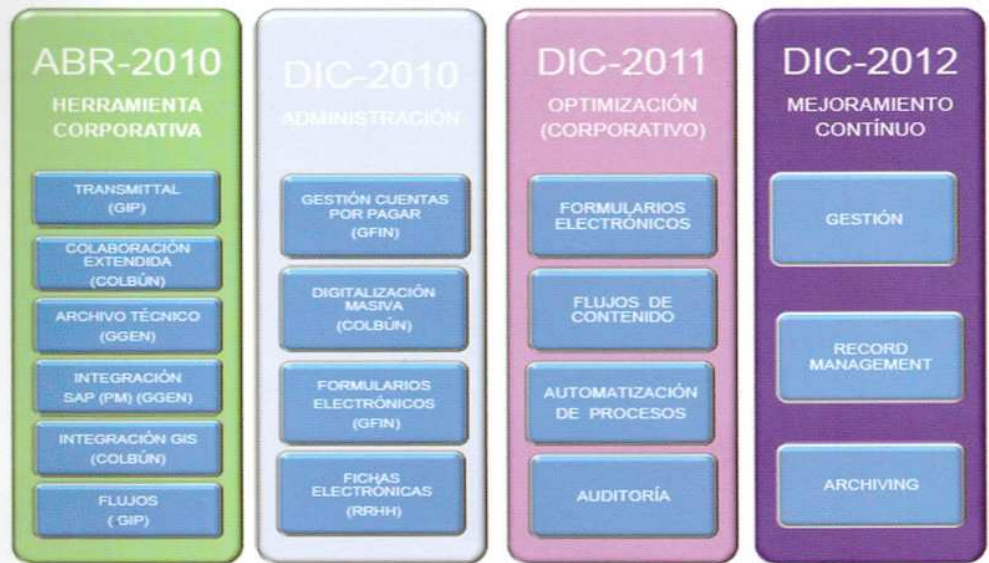
El proyecto de DCL Consultores para Colbún se divide en 4 fases, de las que la primera ha concluido con éxito.

Requerimientos generales. Colbún necesitaba contar con una plataforma corporativa de gestión de documental para soportar la